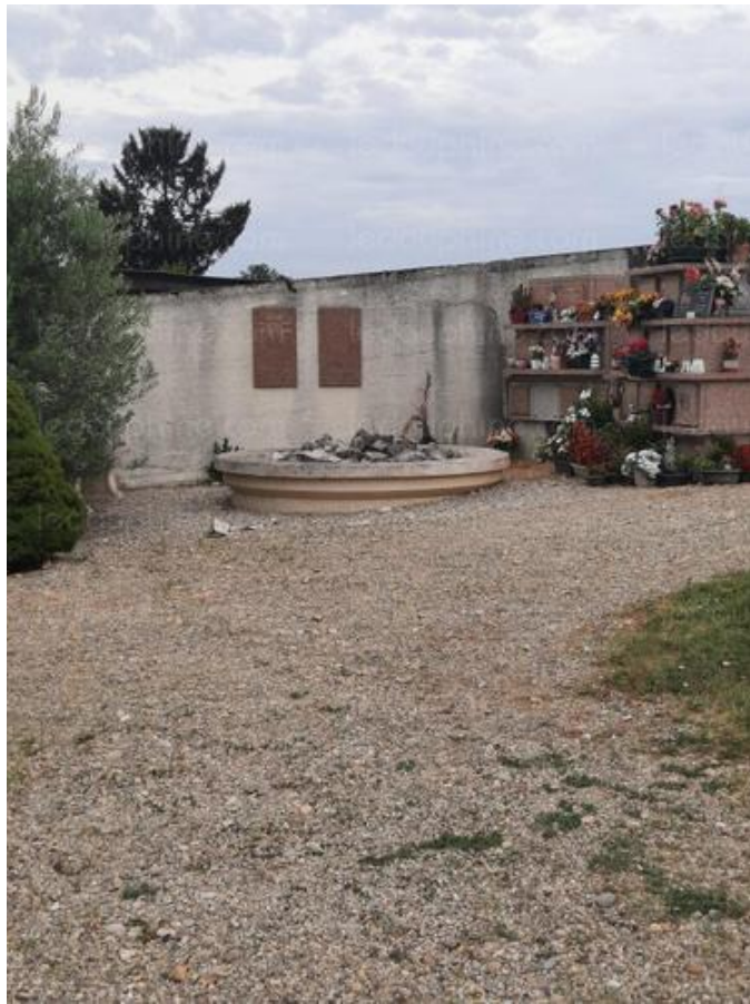
Le columbarium sera agrandi.