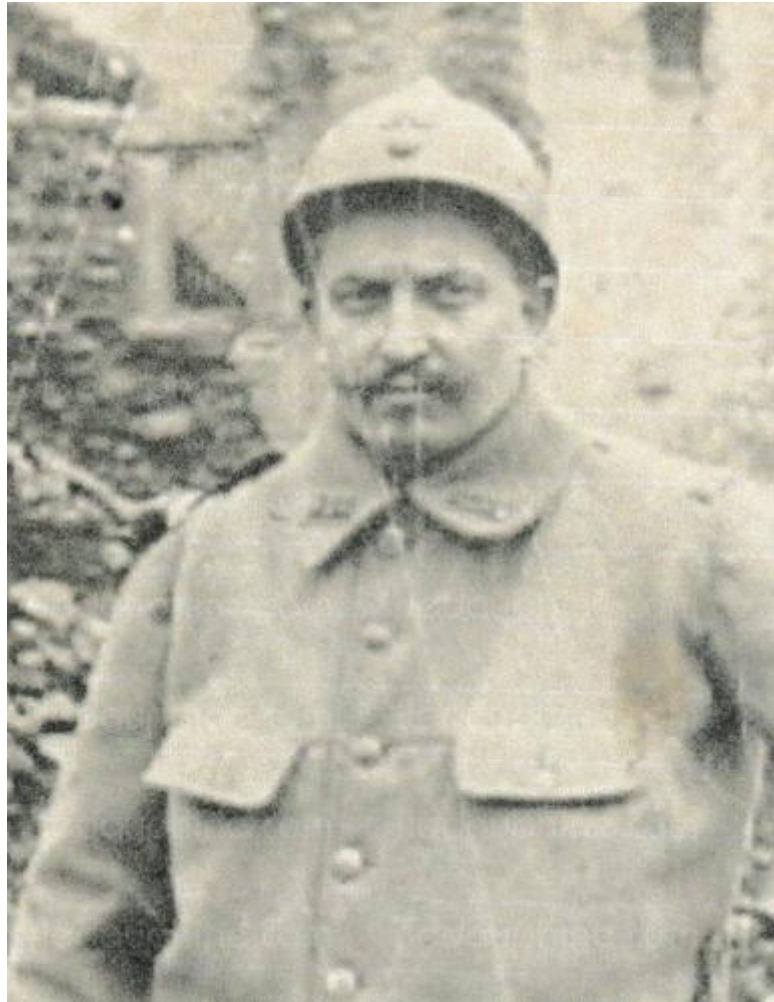
L'adjudant-chef Mazet était le chef de corps.