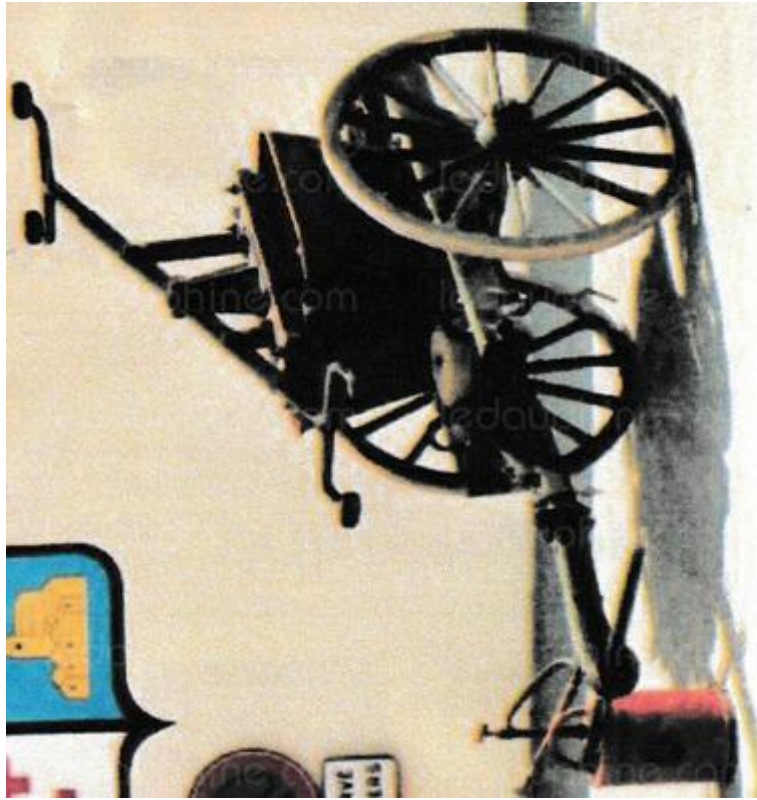
Casques d'époque et la fameuse pompe à bras. Du matériel qui a bien évolué depuis ces années.