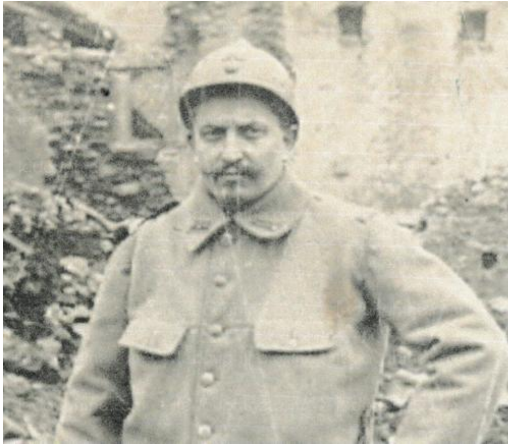
L'adjudant-chef Mazet était le chef de corps.