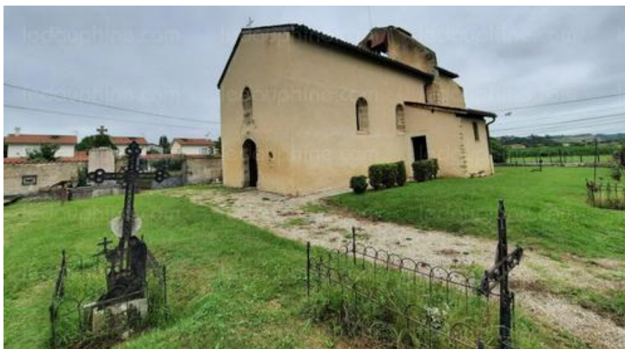
La chapelle d'Illins aujourd'hui et autrefois.

Nous vous proposons une série sur les différents quartiers de Luzinay. Premier volet : Illins.