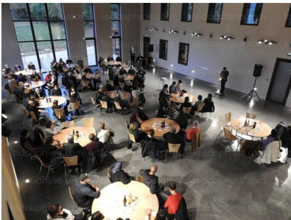
La salle principale de 300 m 2 peut accueillir 300 personnes assises, 600 personnes debout ou jusqu'à 200 couverts.