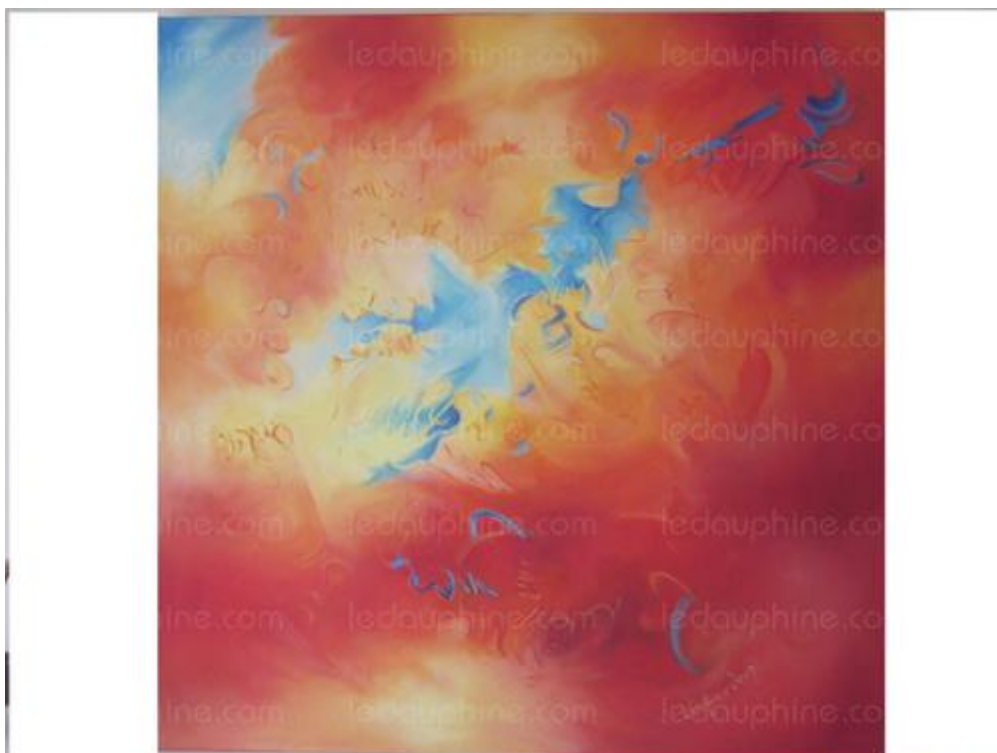
Écriture huile 100x100 E.Droz

L'une des œuvres d'Evelyne Droz « Senteurs boisées ».