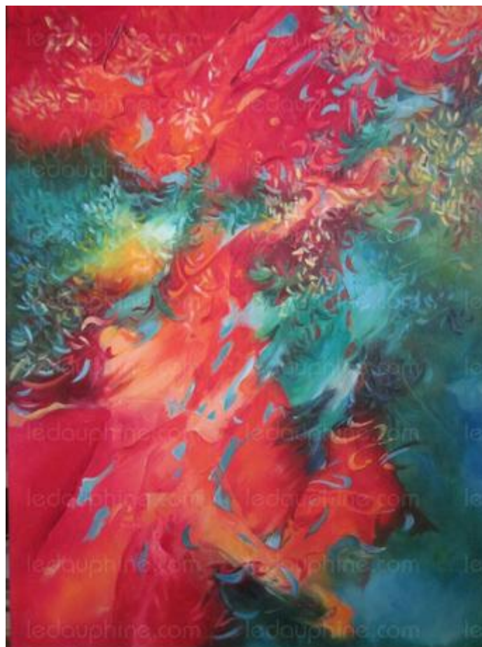
Senteurs boisées huile sur toile 61x46 E Droz

L'une des œuvres d'Evelyne Droz « Senteurs boisées ».