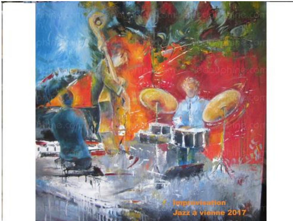
L'une des œuvres d'Evelyne Droz « le jazz à Vienne »