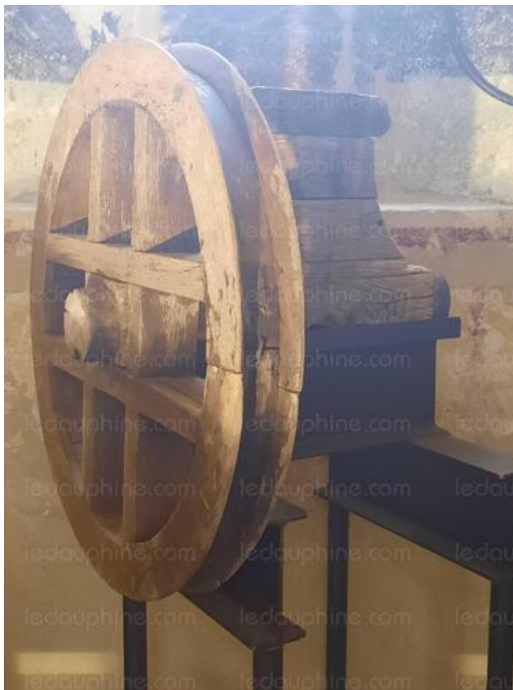
L'ancienne cloche a été conservée et une nouvelle identique l'a remplacée dans le clocher.