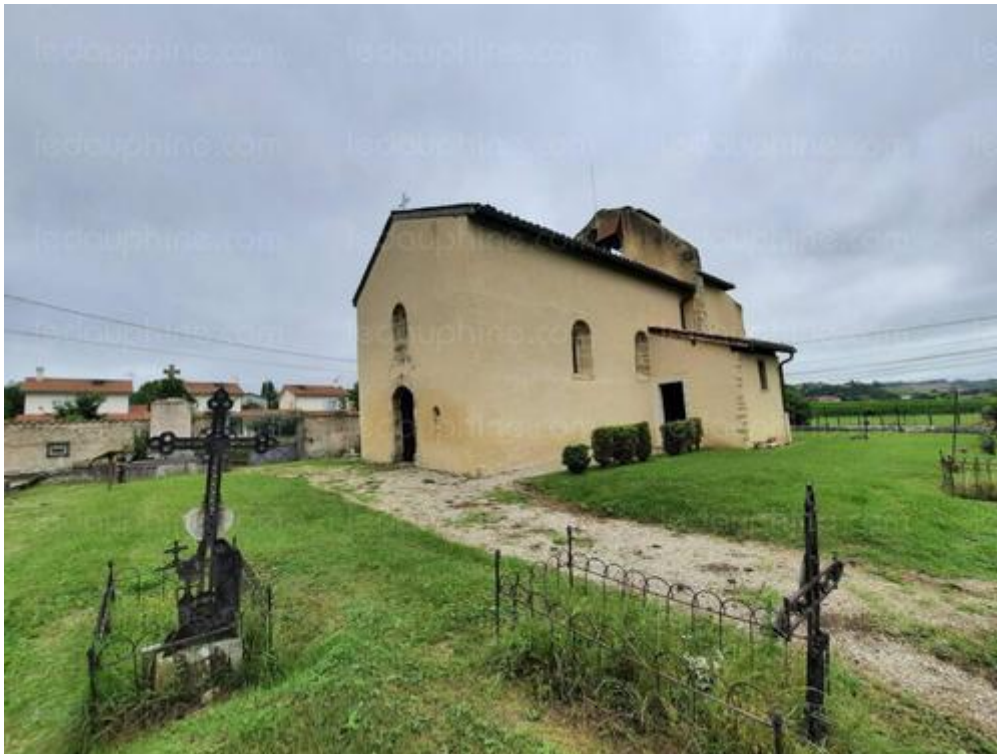
La chapelle d'Illins et l'ancien cimetière du hameau d'Illins. Photo Le DL /Francoise GRANJON

Les vitraux ont été entièrement remplacés. La peinture a été réalisée par Mireille Gayet, présidente de l'association des peintres de Luzinay, Arc en ciel. Photo Le DL /Francoise GRANJON