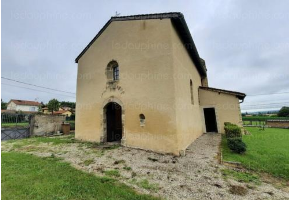
La chapelle d'Illins est le témoin le plus évident de l'histoire du village depuis le Moyen-Âge. La chapelle d'Illins.

Chaque dimanche, durant la saison estivale, nous vous emmenons à la découverte du patrimoine méconnu. Aujourd'hui : la chapelle d'Illins à Luzinay.