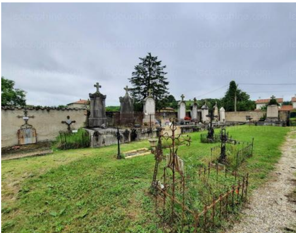
L'ancien cimetière du hameau d'Illins attendant à la chapelle qui n'a plus de vocation religieuse depuis début 2000. L'ancien cimetière du hameau d'Illins attendant à la chapelle.