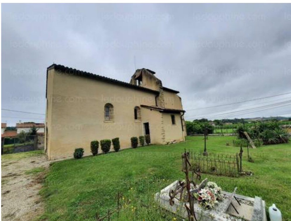
La chapelle d'Illins et son ancien cimetière.