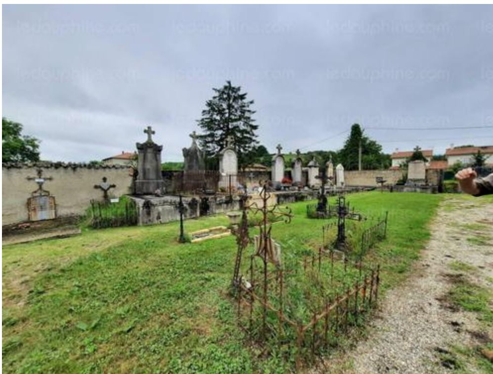
Le cimetière très ancien de la Chapelle d'Illins.