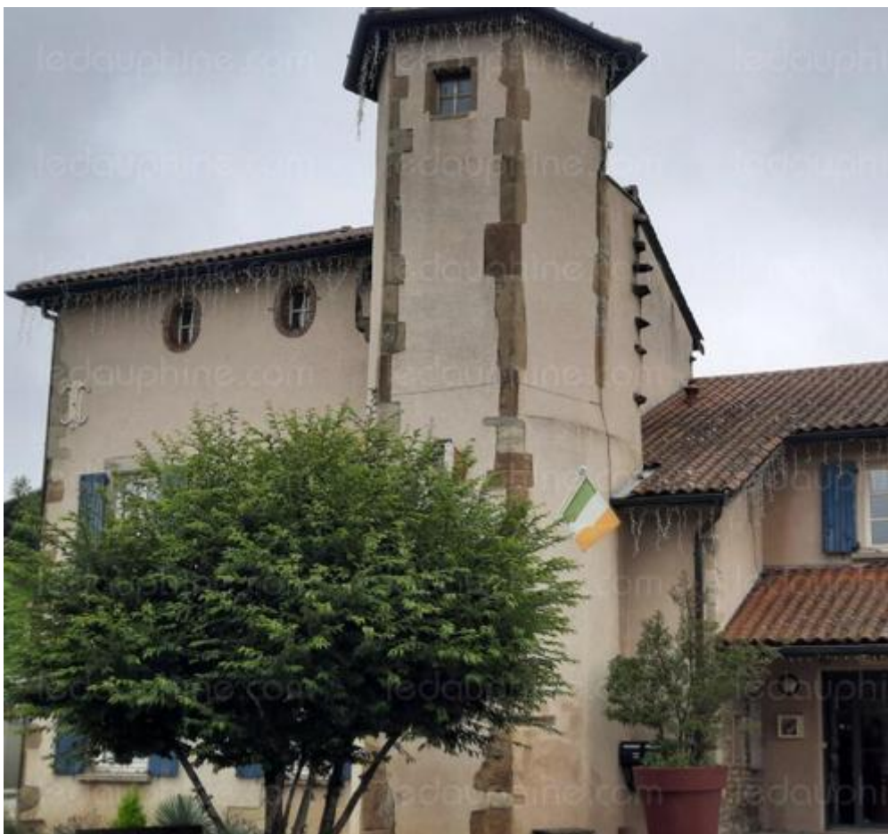
La maison forte du XV e siècle. Elle abrite la mairie de Luzinay depuis 1983. Sa tour lui donne du caractère. La maison forte du XV e siècle dans laquelle la mairie de Luzinay a élu domicile depuis 1983.