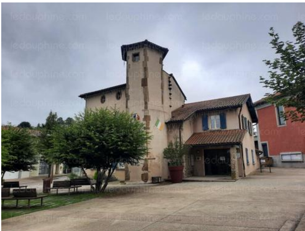
La maison forte du XV e siècle dans laquelle la mairie de Luzinay a élu domicile depuis 1983.