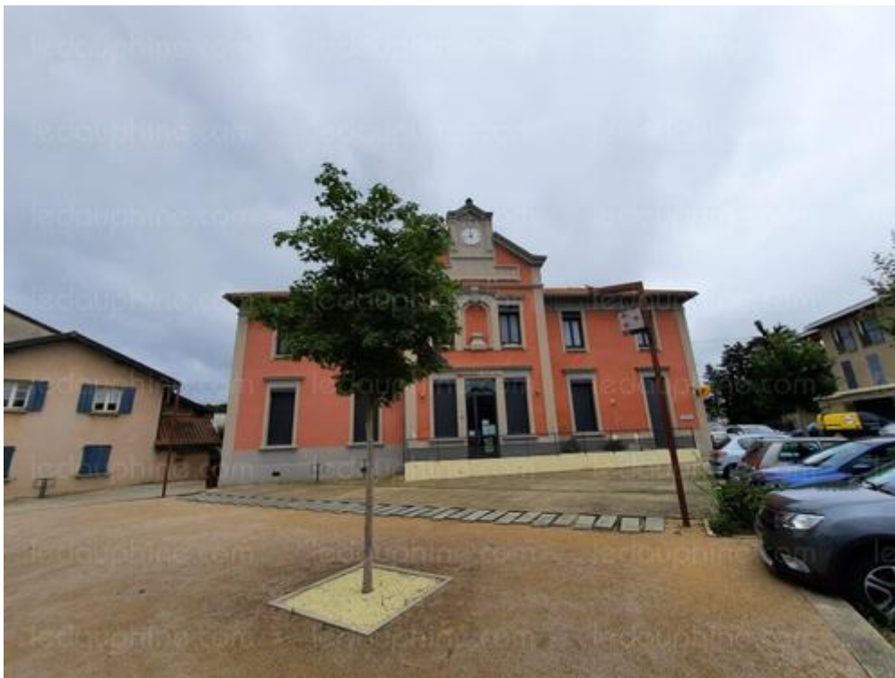
Une autre bâtisse remarquable du village de Luzinay, l'ancien groupe scolaire, sur l'esplanade de la mairie qui abrite aujourd'hui la bibliothèque municipale.