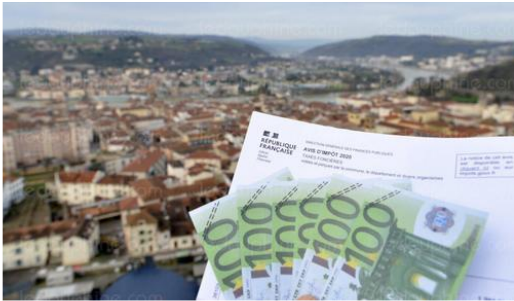
Le taux de taxe foncière est historiquement élevé à Vienne.