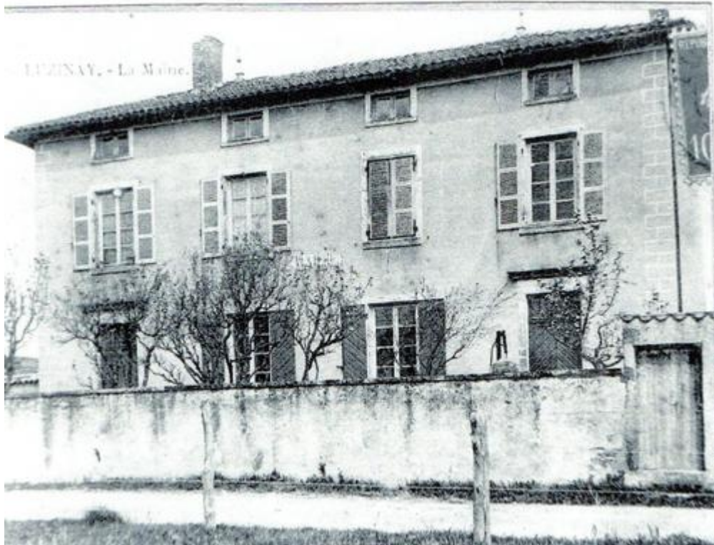
la première mairie