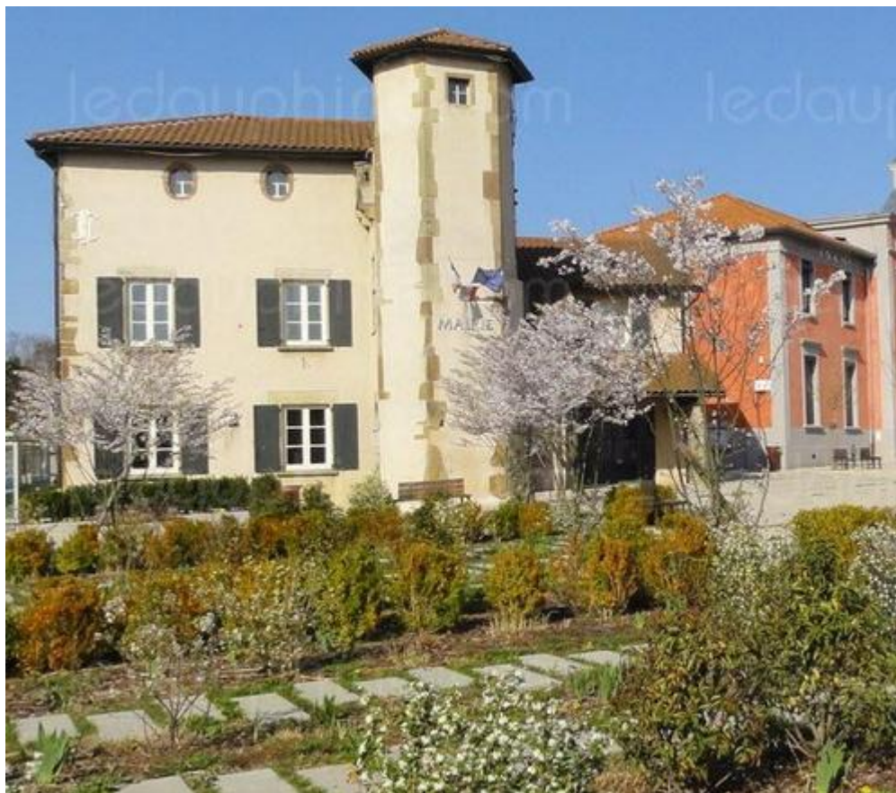
L'ancienne maison forte accueille la mairie. Carte DR – Photo Le DL /Monique CACHAT

Petit retour en photos sur l'évolution du bâtiment de la mairie de Luzinay.