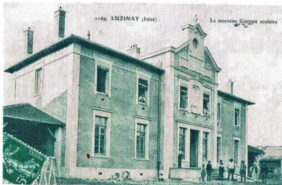
la mairie au centre de 1908 à 1980 les écoles sur le coté